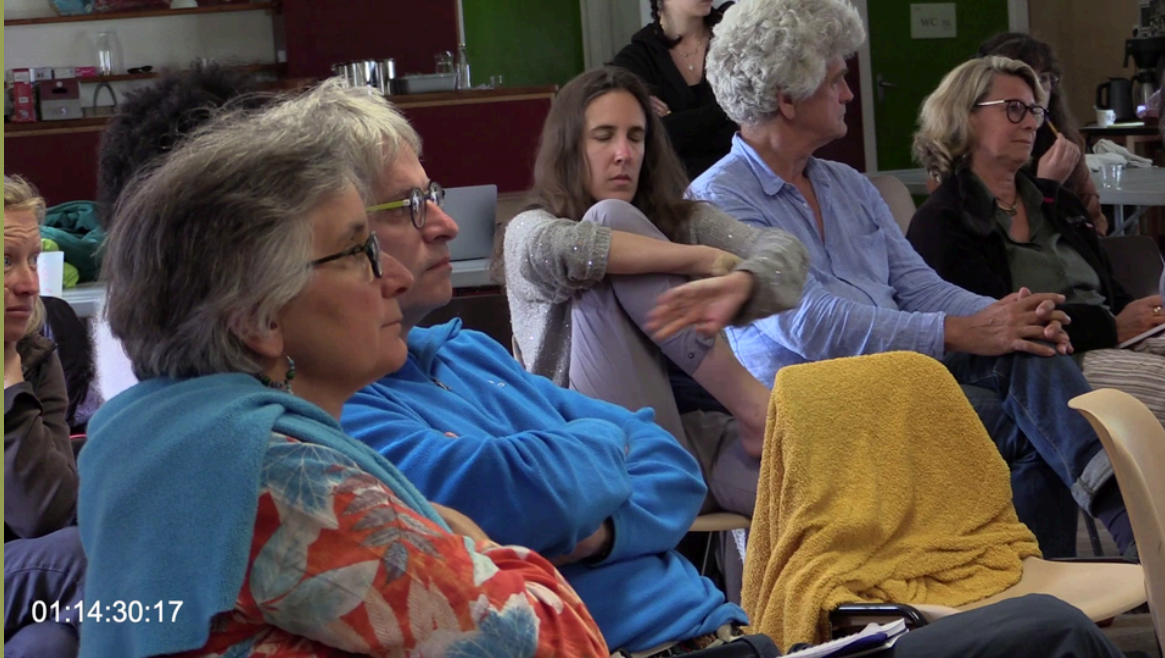
Atelier théorique sur la théorie des systèmes