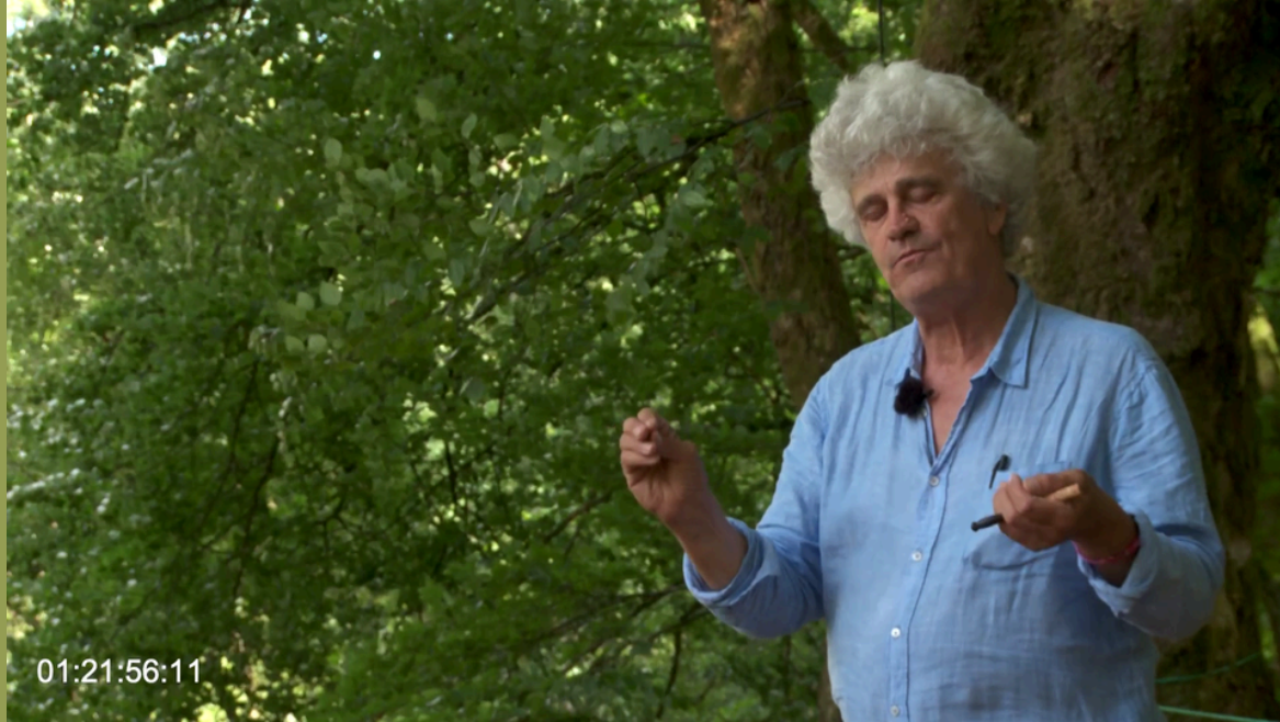
Atelier pratique autour de la poésie au coeur de la forêt