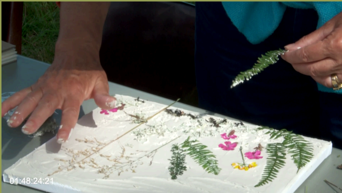
Atelier pratique artistique